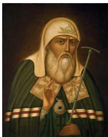
Гермоген Михаил Федорович Романов