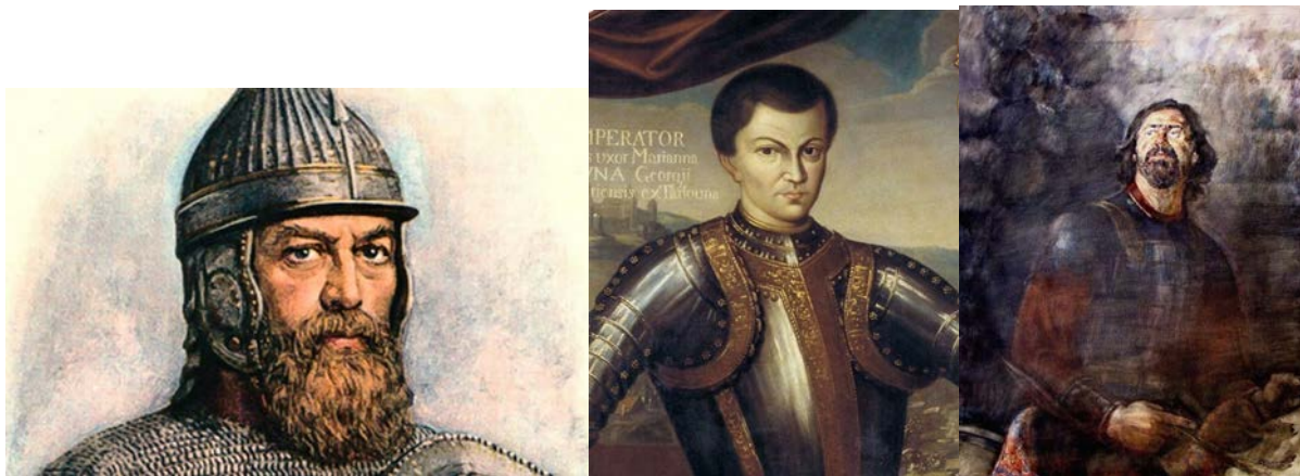
Дмитрий Михайлович Пожарский / Лжедмитрий I / Иван Болотников

Торговый человек, земский староста, призвал создать ополчение для освобождения от иноземных захватчиков (Кузьма Минин).