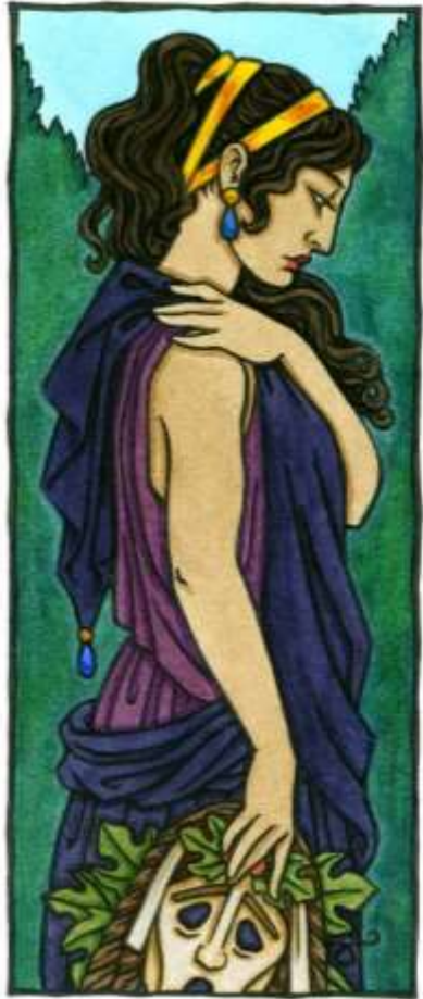
Melpomene Thalia Took

Мельпомена – муза трагедии с трагической маской и венком из плюща