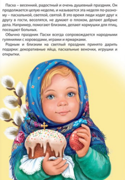
Пасха – весенний, радостный и очень душевный праздник. Он продолжается целую неделю, и называется эта неделя по-разному – пасхальной, светлой, святой. В это время люди ходят друг к другу и гости, веселятся, не забывая о голодом, делают добрые дела. Например, помогают близким, делают кормушки для птиц, посещают больницы. Обычно праздник Пасхи всегда сопровождается народными гуляниями с хороводами, играми и ярмарками. Рядом и близки на светлой неделе принято дарить подарки: декоративные яйца, пасхальные веночки, игрушки и открытки.