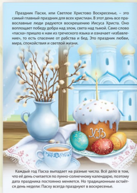
Каждый год Пасха выпадает на разные числа. Все дело в том, что её день считается по лунно-солнечному календарю, поэтому дата праздника постоянно меняется. Но традиционные остаются день недели. Пасху всегда празднуют в воскресенье.

Самый радостный из православных праздников — это Пасха, Воскресение Христово. Этот праздник всегда занимал в творчестве русских писателей особое место. Н.С. Лесков, Н.В. Гоголь, Ф. М. Достоевский, Л.Н. Толстой, А. П. Чехов, Л. Андреев, А. И. Куприн, И. С.Шмелев, И. А. Бунин и многие другие в свои произведения включали события, происходящие или связанные с пасхальной неделей. Предлагаем Вашему вниманию обзор произведений русских писателей, написанных в разные годы, которых объединяет одно – сострадание и любовь к людям, восхищение красотой окружающего мира и простых верующих сердец.